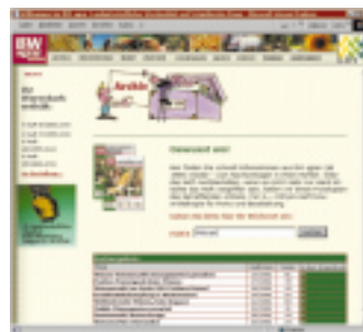
Website, Bereich „Archiv“