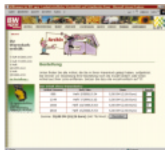
Website, Bereich „Archiv“ – Bestellung